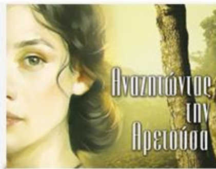
Αναζητώντας την Αρετούσα Audio Book