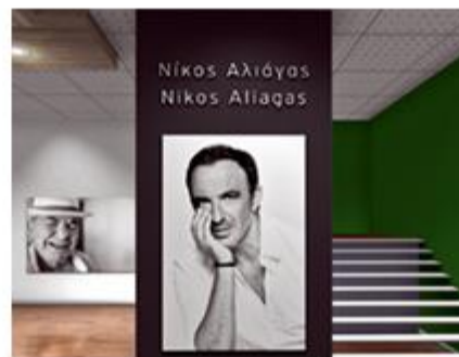
Νίκος Αλιάγας - NGradio The Photographer