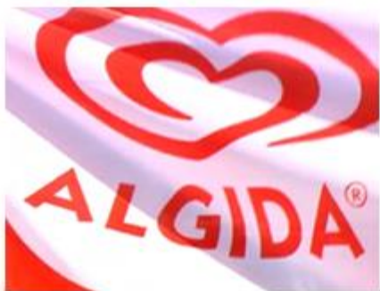
Algida Flash Mob