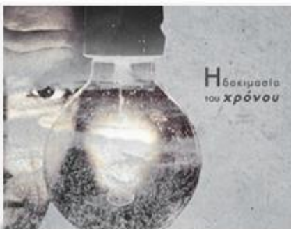
Νίκος Αλιάγας - NGradio Η δοκιμασία του χρόνου

Κομμάτια της δημιουργίας μας. Κάθε φορά...ένα βήμα πιο κοντά στον προορισμό μας.