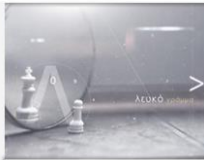
Λευκό Γράμμα CD Content Video