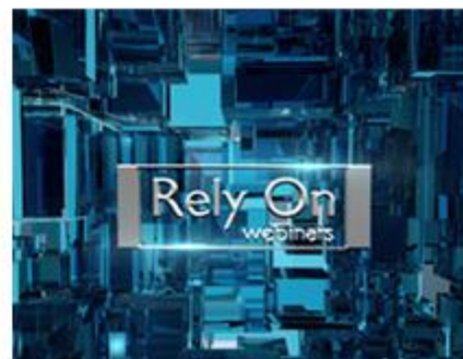
Rely On Webinars Promo