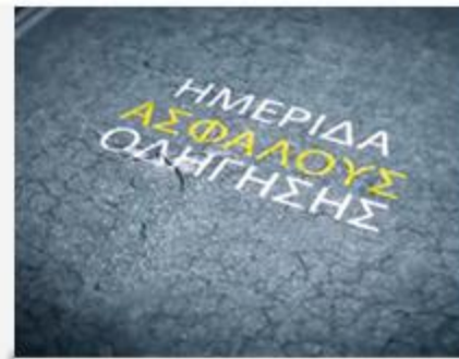
Learn Driver's Club Ημερίδα Ασφαλούς Οδήγησης