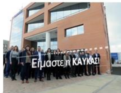
ΚΑΥΚΑΣ Corporate Video