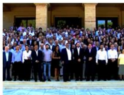
Nestle Sales Meeting