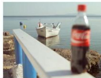
Coca Cola Tvc