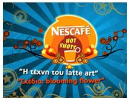
Nescafe Latte Art