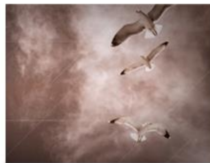
Χ. Τσιαμούλης Video Clip