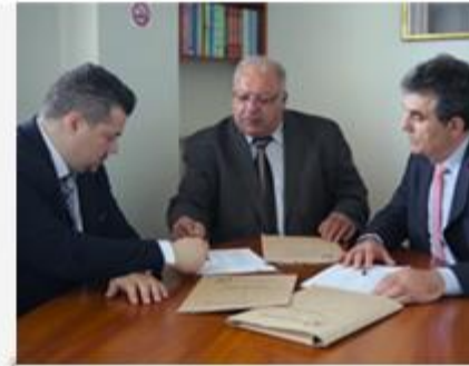
Π. Παντελής & Συνεργάτες Τηλεοπτικό Spot